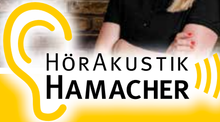
ALEXANDER HAMACHER Hörakustikermeister Päd-Akustiker

2x in Mönchengladbach: Kreuzherrenstraße 5 · MG-Wickrath Konstantinplatz 13 · MG-Giesenkirchen www.hoerakustik-hamacher.de