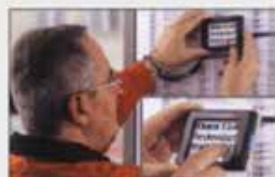
Mit der Schreibschulz-funktion lassen sich Bilder festhalten.