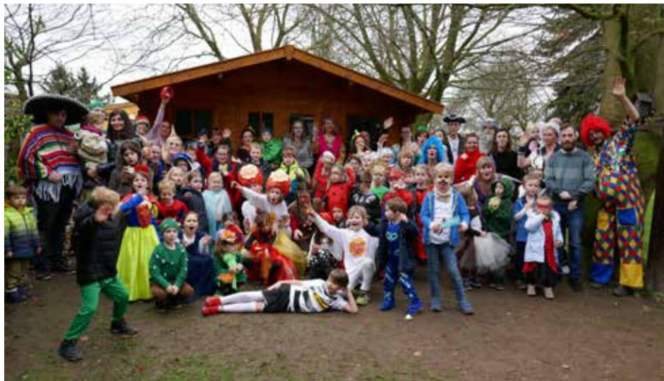
Sie alle besuchten den Kinderkarneval im Gemeindehaus in Beckrath