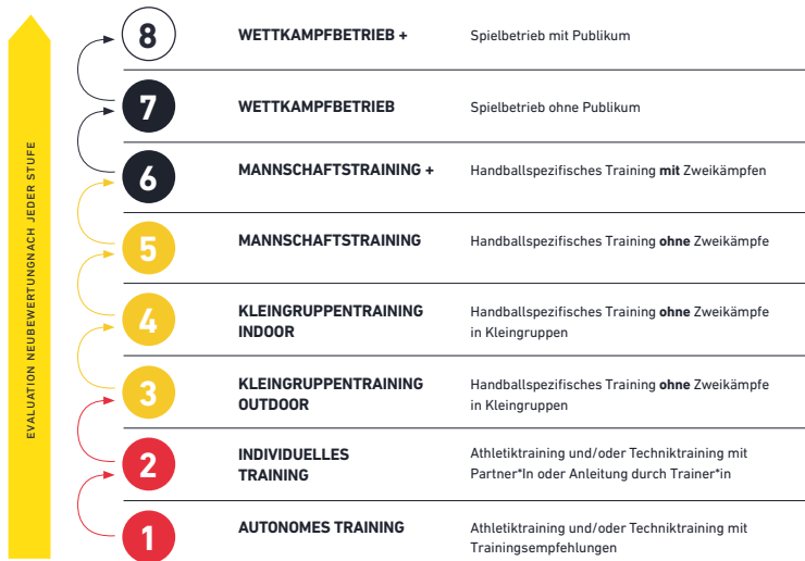
Return-To-Play im Amateursport

Quelle: DHB, Positionspapier zur Wiederaufnahme des Handballsports