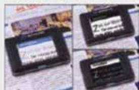
Kontraststark: Für jede Situation und jedes Auge die richtige Farbe.