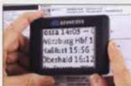
Einfache Bedienung durch große Farbtypografie.